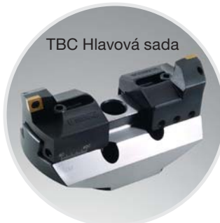
TBC Hlavová sada